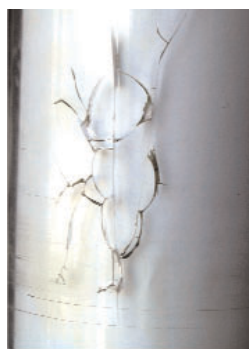
Haarrisse entstehen z.B. durch chemische Reinigungsmittel